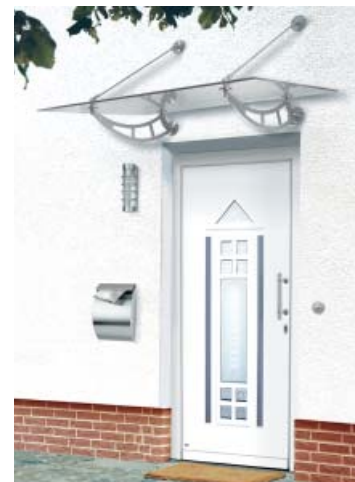
Vordach FANGOR Maße 1600 x 1000 mm Art.-Nr. 083900

elegant geschwungene, trotzdem aber dezente Edelstahl-Konstruktion in Verbindung mit schlichtem Klarglas war ein viel beachtetes Beispiel für das harmonische Zusammenspiel von Form und Funktion im Hauseingangsbereich.